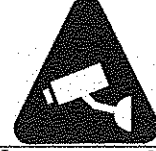
CCTV கமராக்கள் இப்பகுதியில் செயற்பாட்டிலுள்ளன.

31. தொடர்பாடல் வகை ஒன்றும், தொடர்பாடல் வடிவம் ஒன்றும் முறையே அமைவது