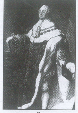
B (04 புள்ளிகள்)